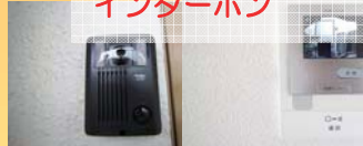
②TVモニター付インターホン