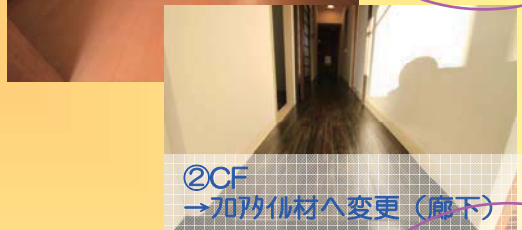
②CF →707材へ変更 (廊下)