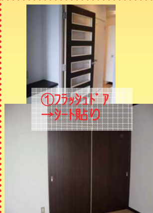
①ワッパドア →シート貼り