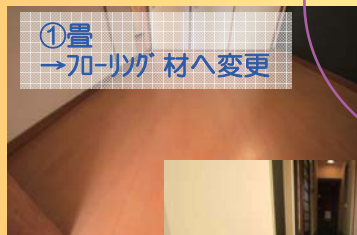
①畳 →70-リッパ 材へ変更