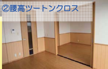
②腰高ツートンクロス