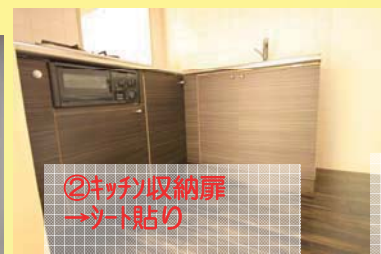
②キッチン収納扉 →シート貼り