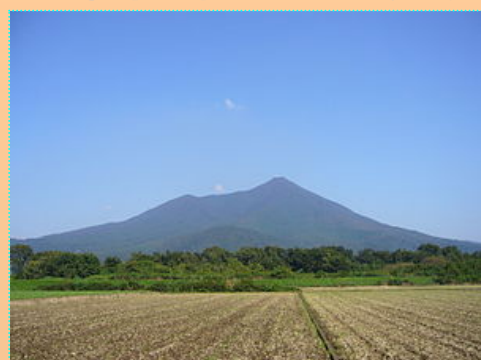
「西の富士、東の筑波」といわれるように、全景が美しい山として有名

暑さの残る季節ではありますが、昨今の登山ブーム・スポーツの秋ということで茨城県が全国へ誇る名山である筑波山のご紹介をします。