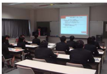
2014.3.1 茨城県県南生涯学習センター