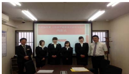
2013.10.1 内定式 本店会議室